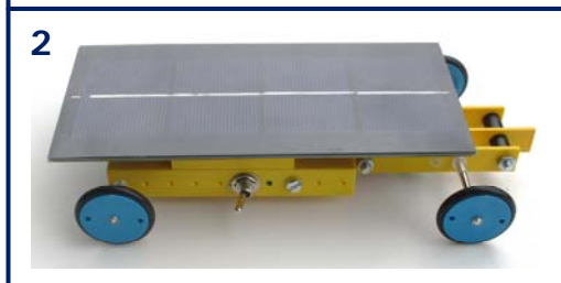
Bild 2 zeigt den Schalter auf der rechten Fahrzeugseite, in Bild 3 zeigt die Frontansicht mit dem Motor, dem Getriebe und der Vorderachse.

Hinter der Vorderachse befindet sich ein 2- stufiges Getriebe und der Solarmotor, der direkt vom Solarstrom des Solarmoduls angetrieben wird. Mit einem Schalter lässt sich das Fahrzeug ausschalten, damit es nicht unbeabsichtigt im hellen Licht losfährt.