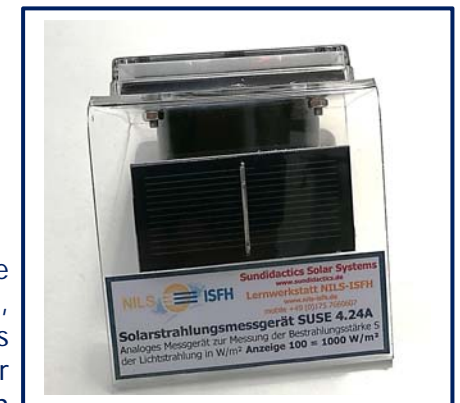
Oben: Die Solarzelle und das Typschild auf der Rückseite Unten: Der Innenraum mit dem Nebenwiderstand (grün).

Auf den elektrischen Stutzen des Amperemeters wird die M4- Unterlegscheibe aufgelegt, darüber die Lötöse, darüber die 2. Scheibe, dann der Federring, durch alle 4 Elemente wird die Schraube eingeführt und am Innengewinde des Stutzens verschraubt. Die Lötösen zeigen zur Solarzelle. An das Ende der Lötöse am Pluspol des mA- Meters wird das rote Pluskabel angelötet, an den Minuspol das schwarze Minuskabel. Das Gerät zeigt bereits an, Achtung, nicht in helles Licht gehen, das Messwerk könnte überlastet und zerstört werden, der Nebenwiderstand fehlt ja noch!