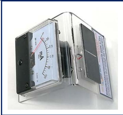
Das Strahlungsmessgerät SUSE 4.24A , auf der rechten Dachseite befindet sich die Solarzelle, auf der linken Dachseite das Anzeigeinstrument, ein 100-mA-Meter.

Das Solarmodul SUSE 4.24A ist ein analoges Messgerät zur Messung Bestrahlungsstärke S des Sonnenlichts oder des Lichts von Lichtquellen in der internationalen Maßeinheit W/m^2 .