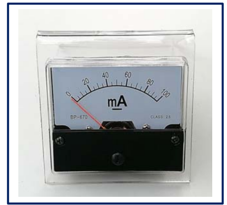
Einbau des mA- Meters auf der Vorderseite

Von den doppelseitigen Klebbändern auf der Rückseite des Solarmoduls werden die roten Schutzfolien abgezogen, anschließend wird das Modul passgenau über das 24mm- Loch geklebt. Anschließend wird das selbstklebende Typschild außen an der blauen Rahmenlinie ausgeschnitten und direkt unterhalb des Solarmoduls aufgeklebt.