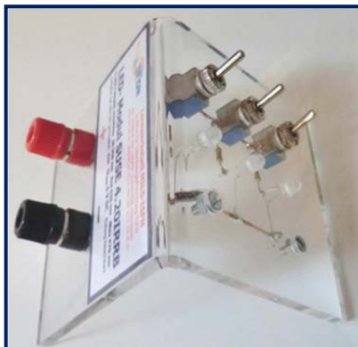
Das LED- Modul SUSE 4.20 IRRB Auf der linken Seite befinden sich die beiden Polklemmen und das Typschild, rechts in der Mitte die 3 LED's, oben die 3 Schalter

LED- Modul mit 3 einzeln schaltbaren LEDs: Infrarot IR 950 nm, rot 626 nm, blau 470 nm