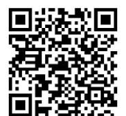
QR technische Daten Solarzelle SUSEmod5

Notiere Deine Beobachtungen und Auswertungen hier: