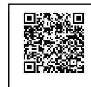
Handbuch Station 4