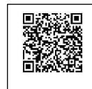
Handbuch Station 5